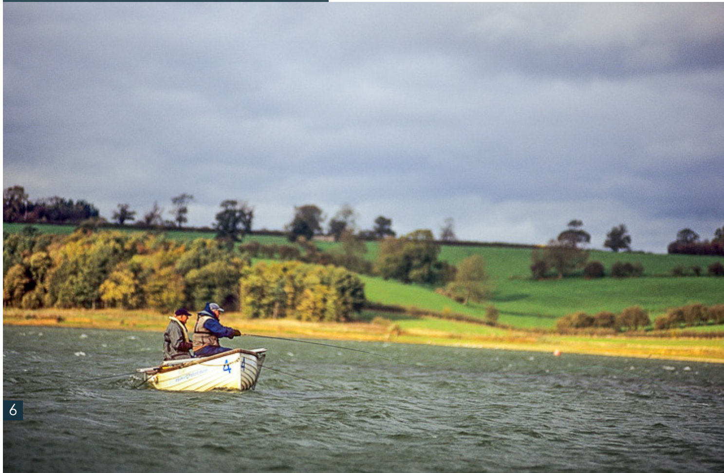
6 – Pitsford Water