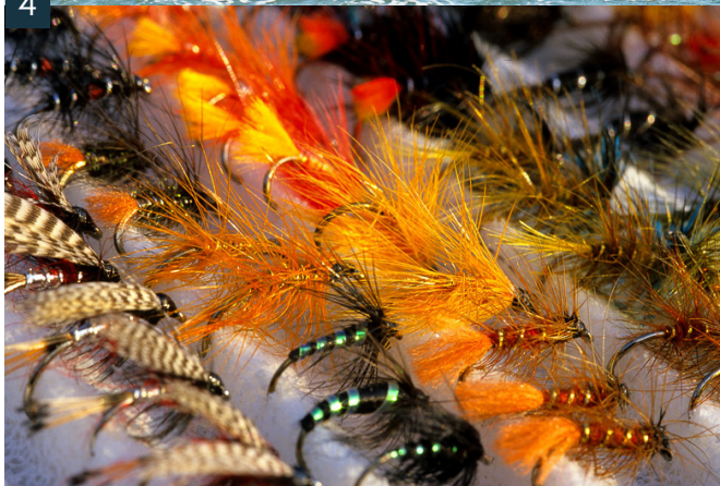
4 – Dérive à Bewl – Mouches noyées

C'est à Bewl qu'un mois de juin, ma nouvelle Loomis 9'6 soie de 7 fit un arc de cercle par dessus la jolie barque en bois, en direction d'un lingot d'argent. Beau combat avec un poisson en pleine forme sorti de sa cage depuis quelque temps. Mise à l'épreuve du matériel, canne, soie, bas de ligne, je prie pour que mes nœuds résistent. Le poisson finit à l'épuisette.