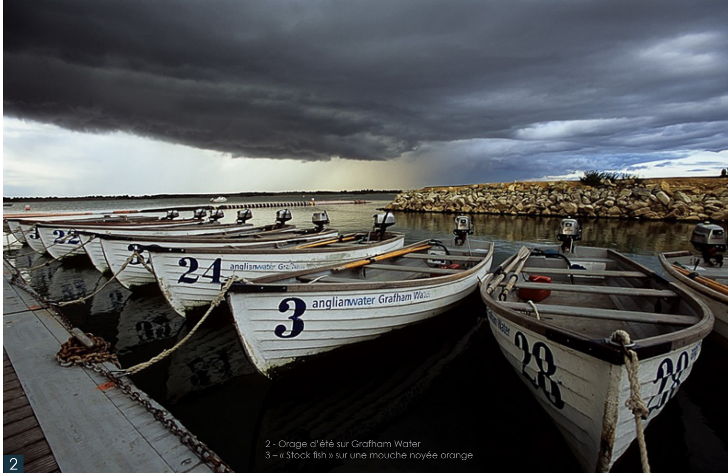
2 - Orage d'été sur Grafham Water 3 - « Stock fish » sur une mouche noyée orange

2 semaines passent, l'automne arrive, lancer de bout de laine.