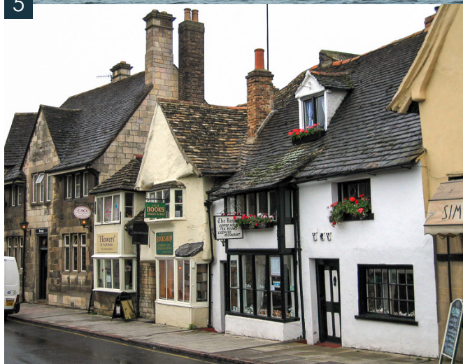
5 – Fin de journée d'automne à Bewl – Village typique

de couleurs, rose, pêche, corail, blanc... Très efficaces aussi : chiros, petits streamers, noyées, imitations de poissonnets... Elles sont aussi faciles à monter en général, vous pourrez aussi en trouver sur place à la boutique.